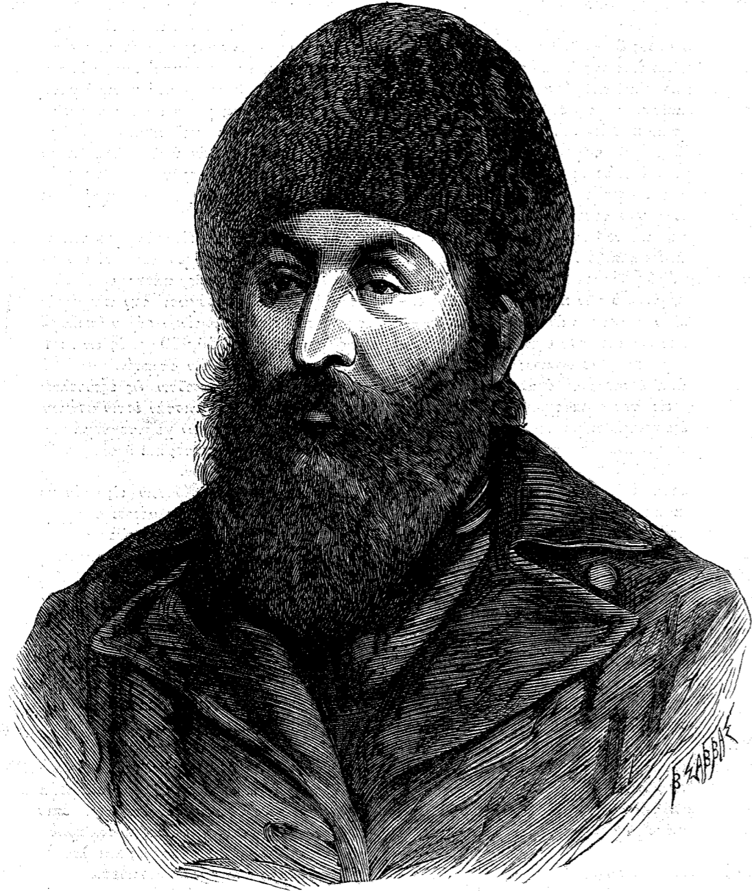
ΣΧΗΡ ΑΛΗΣ, Έμίρης του Καβούλ.

οι Αφγάνες εισι πιθανώς Ιουδαϊκής καταγωγής μετατοπισθέντες εκ της γενετείρας αυτών γης υπό του Ναβουχοδονώσορος και άφιχθέντες μέχρι του Χεράτ. Έννεά από της εμφάνισεως του Μωάμεθ ως προφήτου έτη, ούτοι απέστειλαν πρεσβείαν εις Μέδιναν όπως έρευνήση τά κατ' αυτόν ή πρεσβεία δ' αύτη ήσπάσθη